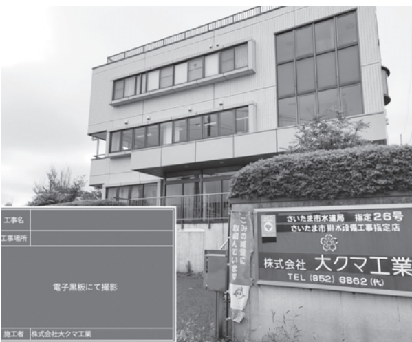
施工者 株式会社大クマ工業

板に記入し、また一人で撮影できない場合は職人に黒板を持ってもらう必要がありました。が、電子黒板であれば文字や略図を手で書かず撮影画面で自由に黒板を配置・縮小ができ、一人で撮影が可能に。雨の日に外での撮影だとチョークが滲んで文字が消えてしまったりしていたが電子黒板ならばつきりと撮影ができる。