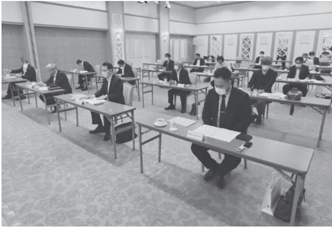
全議案が承認されました

冒頭、飯沼会長はコロナ禍にもかかわらず、事業活動を含めた円滑な協会運営に尽力した会員へ敬意を表するとともに、収入の3本柱である会費収入、共済互助事業、埼玉県