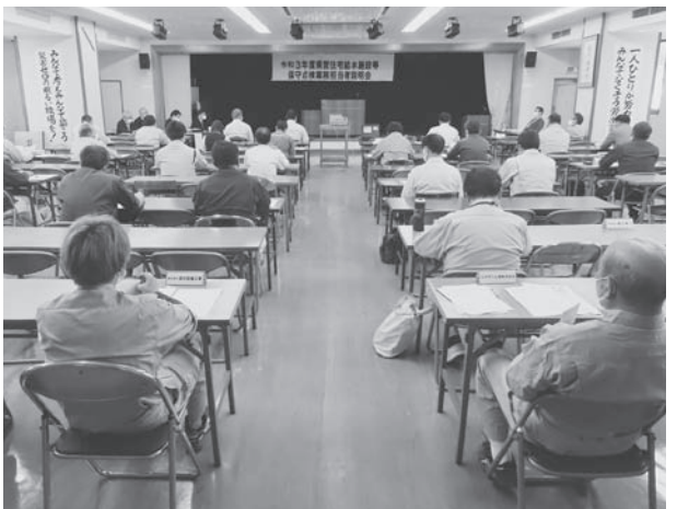
2年ぶりの開催となった説明会

4月21日、さいたま市内にある埼玉県管工事会館3階の大会議室で、県営住宅給水施設等保守点検業務担当者説明会を開きました。昨年度は新型コロナウイルス感染症拡大を考慮して中止としましたが、今年度は感染防止対策を徹底したうえで、埼玉県住宅供給公社の公営住宅技術課と県内4支所より6人の職員を招聘し、約50人