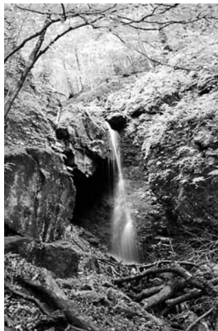
そぐ長い旅が始まる。まさに「大河の一滴」を見たような気がする。ある。