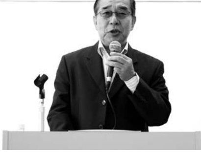
あいさつする大原会長