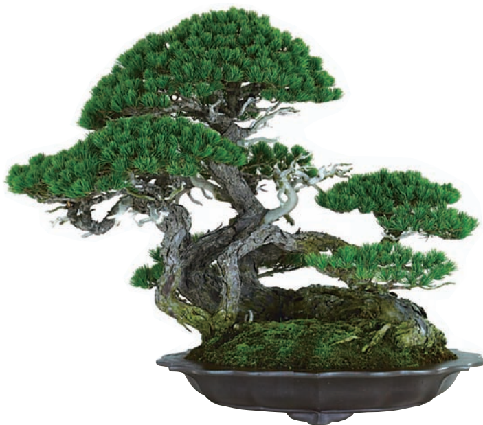
【五葉松 鉢—大昭渡紫泥古鏡型 樹齡—約350年】

私事ではありますが、5月15日、東京プリンスホテルにおいて開催された平成26年春の叙勲伝達式において、僭越ながら旭日小綬賞を授与賜りました。これもひとえに皆様方の日頃のご尽力の賜物であり、まずもって、ここに御礼申し上げるとともに、ご報告申し上げます。ありがとうございました。